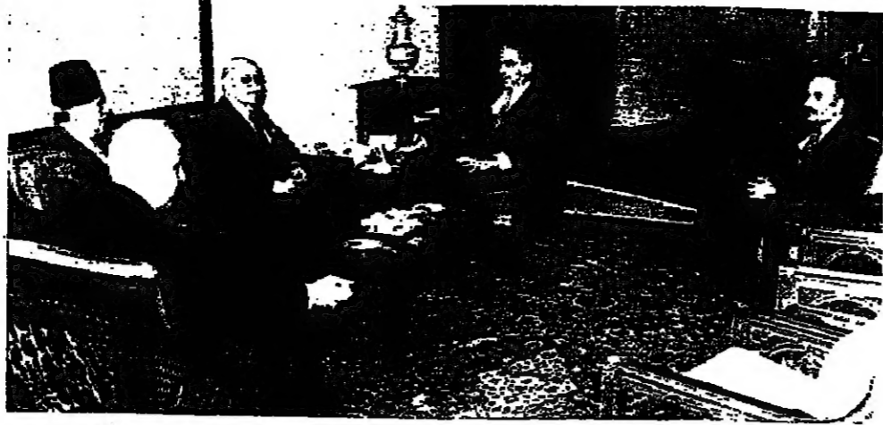
الرئيس شكريش يستقبل الرئيسين سلام والمصلح والسيد حسين المصني ومحمد صني الدين

شغل المتد جلساء مجلس الوزراء صباح امير اجتماع بين الرئيس اليماني والوزير الفلسطيني في لبنان السيد رشاد باركر وعرض خلاله المعلومات المتوفرة من آخر تطورات الوضع في الجنوب والقطاع. وقد انضم الرئيس سليم الحص الى الاجتماع الذي بدأ في التاسعة صباحا واستمر حوالي ساعة. وفي العاشرة والتفصلا تم عقد مجلس الوزراء في غياب الوزيرين نواف بطرس والدكتور احمد زكي وكلاهما في مهمة رسمية. لا تعليق في الثانية والربع انتهت الجلسة، ورد الرئيس الحص على الاسئلة التي وجهت اليه بقتضاب كلسي وبلوجبة التي: ما رأيك بالدعوة التي وجهها بين الرئيس الجمهورية لزيارة اسرائيل؟ وماذا عن موقفك من دعوة بيغن لزيارة اسرائيل؟ هل ابلت الدعوة لمجلس الوزراء؟ لم يبع مجلس الوزراء بذلك. هل ابلغ باركر الرئيس شكريش هذه الدعوة؟ ما هي الشروط المزمعة للتفويض؟ اسالوا رئيس الجمهورية في يومه ما بالوضع كثيرا، والاتصالات تم معه شخصيا ومع رئيس الحكومة، وهذا يتوافق بالنسبة الى هذا الموضوع الكفر. وانا اكثر ما قلته دائما ان اي خطر يهدد الجنوب سيكون له تاثير على كل لبنان، وتحييلا خطرا على لبنان ككل، وان يقصر الكفر على الجنوب.